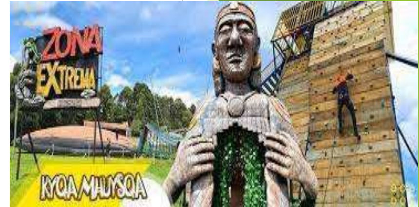
Facatativá – Contiguo al Parque Arqueológico Piedras de Tunjo.

Nota: La boletería se debe solicitar previamente (mínimo 8 días de anterioridad) indicando fecha de visita del parque y datos de titular para poder generar la reserva.